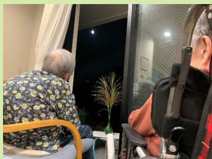
フロアからも中秋の名月が はっきり見えましたよ