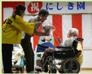
施設長から花束の贈呈