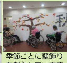
季節ごとに壁飾りを制作しています