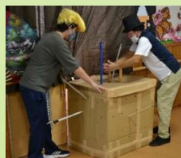
9/15 敬老会 100歳を迎えられた方の表彰式のあと、福釣りや職員による手品を楽しみました。