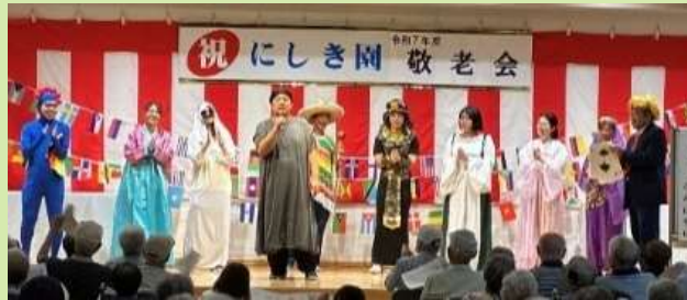
万博開催を祝って『世界の国からこんにちは！』