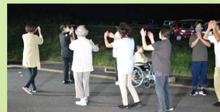
9/15 ご家族の皆様と一緒に、夕食会、ビンゴゲーム、盆踊り、花火大会を楽しみました。